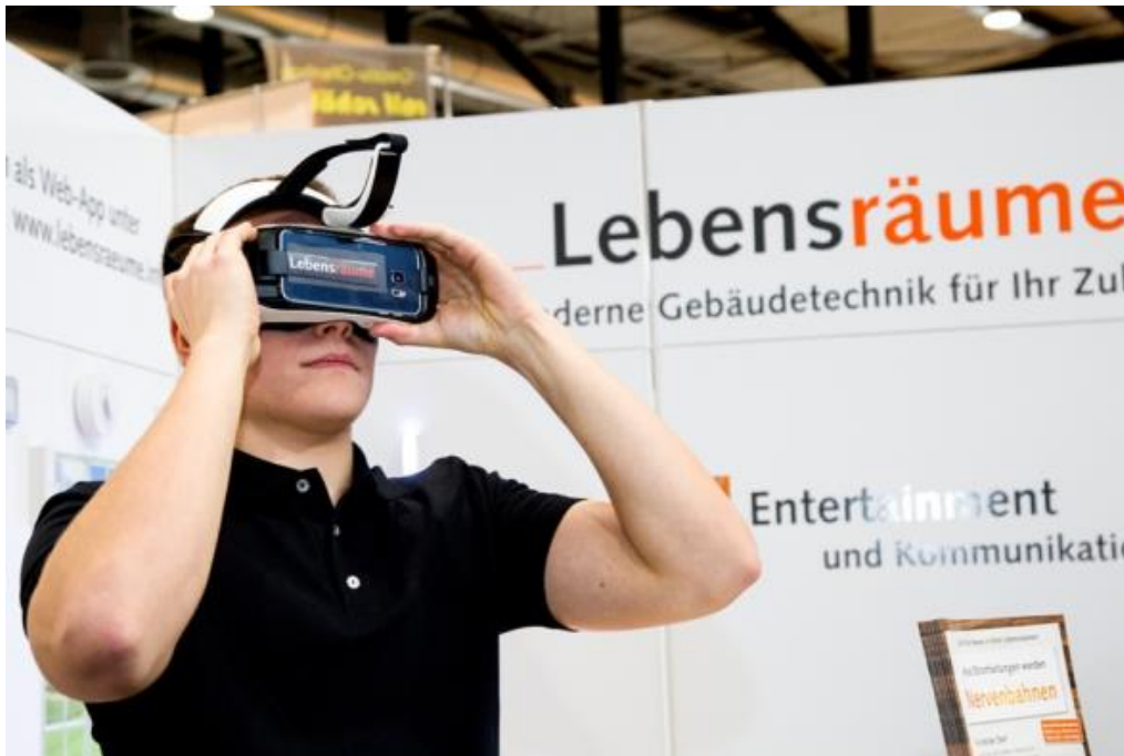
So sieht die Zukunft aus: Showroom „Lebensräume“ gibt Einblicke über Neuheiten im Smart Home.

Weiteres Bildmaterial von der Gebäude.Energie.Technik zum Download: