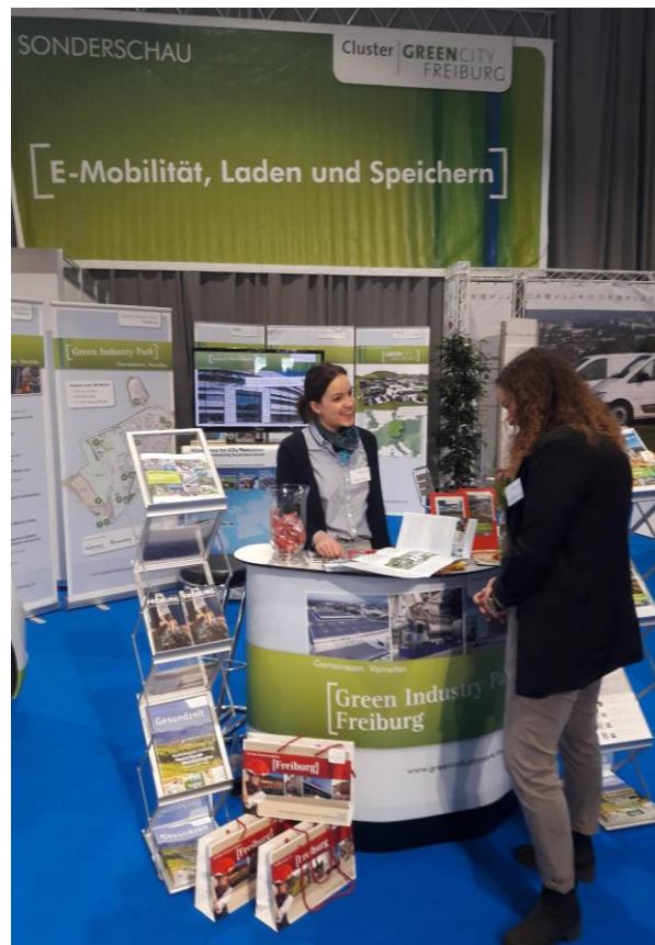
Impressionen Sonderschau Urbane Mobilität / GETEC